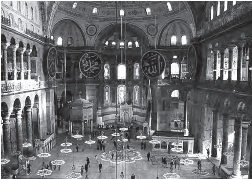
Figura 1. – Istanbul, S. Sofia, veduta dell'interno dalla galleria occidentale (G. Marsili).

La precisa connotazione professionale di Antemio e Isidoro è chiaramente indicata da Procopio attraverso la locuzione ἐπί σοφία τῆ καλουμένη μηχανικῆ λογιώτατος 4 , per il primo, e l'attributo μηχανοποιός, per il secondo. Essi sono quindi identificati come i massimi detentori della scienza meccanica, sia teorica che pratica 5 .