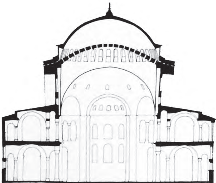
Figura 4. – Istanbul, S. Sofia, sezione dell'alzato con indicazione dell'innalzamento della cupola realizzato da Isidoro il Giovane (da Warren 1976).

In assenza o morte dei genitori naturali, la responsabilità dell'educazione poteva essere assunta dai parenti più stretti, soprattutto nel caso in cui questi ultimi ricoprissero cariche pubbliche, sia civili che ecclesiastiche 53 . Anche la fase più avanzata degli studi, affidata ad accademie o docenti specializzati, subiva spesso l'influsso di zii e nonni e diversi casi attestano come lo zio materno ricoprisse un ruolo primario nell'educazione dei giovani nipoti, divenendone il modello professionale per eccellenza 54 . Il rilievo di questo aspetto della formazione, in specifici contesti cronologici, è talora sottolineato anche da provvedimenti imperiali, come tre editti di età costantiniana finalizzati ad incrementare la formazione di mechanicoi ,