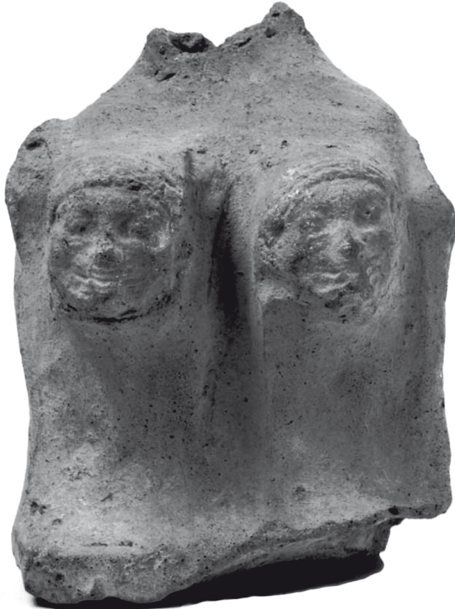
Fig. 1. - Capua, Museo Provinciale Campano, scultura fittile, cm 12,1 × 10,4 × 8,2.

Ritengo sia quasi sicura l'appartenenza al Fondo Patturelli, perché alla specificità del soggetto si aggiunge la provenienza da quel santuario della quasi totalità dei reperti pervenuti al Museo Campano. Le caratteristiche tecniche e la stessa tradizione coroplastica di Capua lasciano escludere che la parte inferiore possa essere stata lavorata con altro materiale o in tessuto su un'anima di legno. La figura muliebre veste una tunica con risvolto, che potremmo anche indicare come apoptygma , e sui seni mostra due protomi di Gorgone ottenute a stampo e applicate ad impasto tenero prima della cottura. L'interno è cavo e la frattura avvenne nel punto più debole, dove la parte superiore della statua si innestava su quella inferiore. La circonferenza pseudo-ovale della rottura induce a supporre, infatti, un innesto sull'altra parte del corpo si-