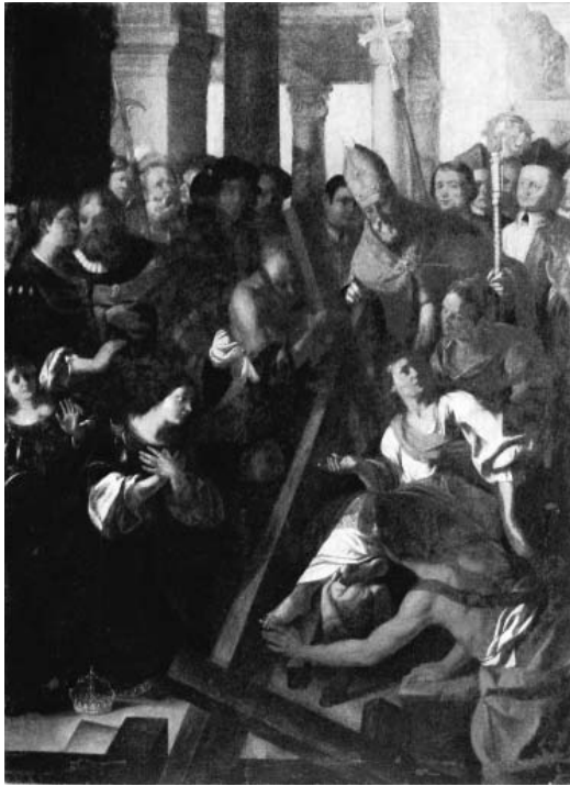
Fig. 16. - Tommaso Gazzini (?), Inventio crucis, Mantova, San Maurizio.