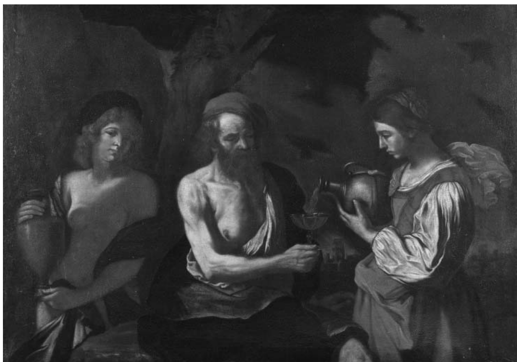
Fig. 3. - Guercino (copia da), Lot e le figlie, Mantova, Museo di Palazzo Ducale.