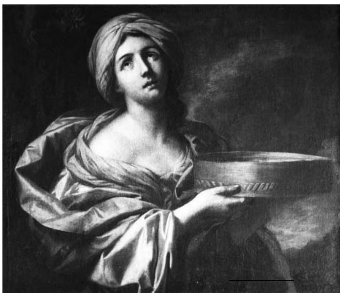
Fig. 15. - Lorenzo Pasinelli (?), La vestale Tuccia, ubicazione ignota.