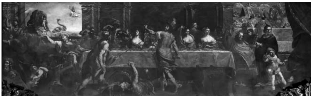
Fig. 14. - Lorenzo Pasinelli, Nozze di Perseo, Mantova, Municipio.