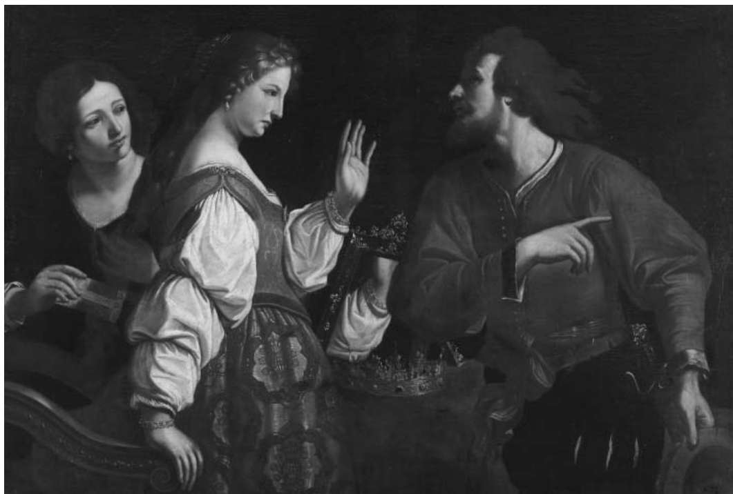
Fig. 2. - Guercino (copia da), Semiramide riceve la notizia della rivolta di Babilonia, Mantova, Museo di Palazzo Ducale.