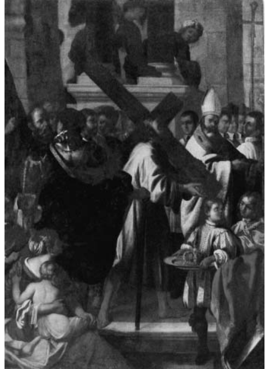
Fig. 17. - Tommaso Gazzini (?), Esaltazione della croce, Mantova, San Maurizio.