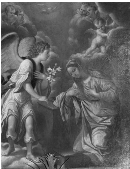
Fig. 7. - Marcantonio Donzelli, Annunciazione, Ospedale di Pieve di Coriano.