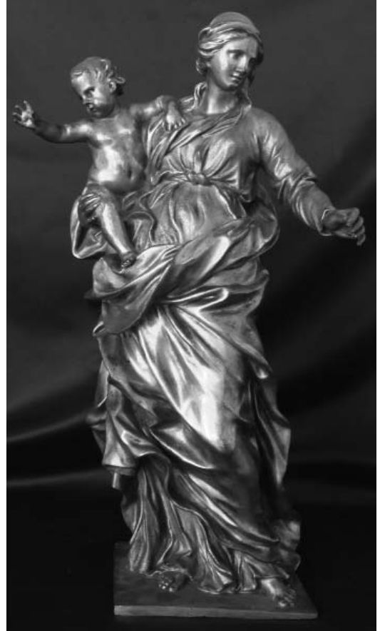
Fig. 12. - Alessandro Algardi (copia da), Madonna del Rosario, Mantova, Museo Diocesano.