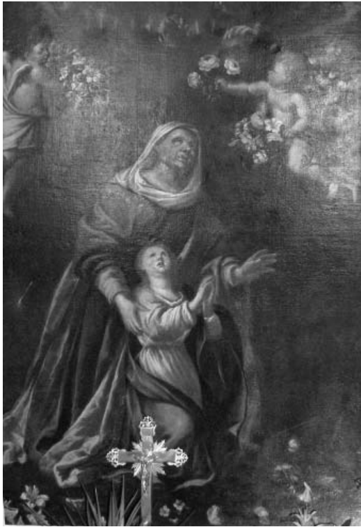
Fig. 10. - Marcantonio Donzelli, Sant'Anna e la Vergine, Casatico, Annunciazione della Beata Vergine.