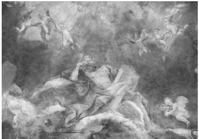
Fig. 18. - Giovan Battista Caccioli, Dottori della chiesa (part.), Mantova, Palazzo della Ragione.