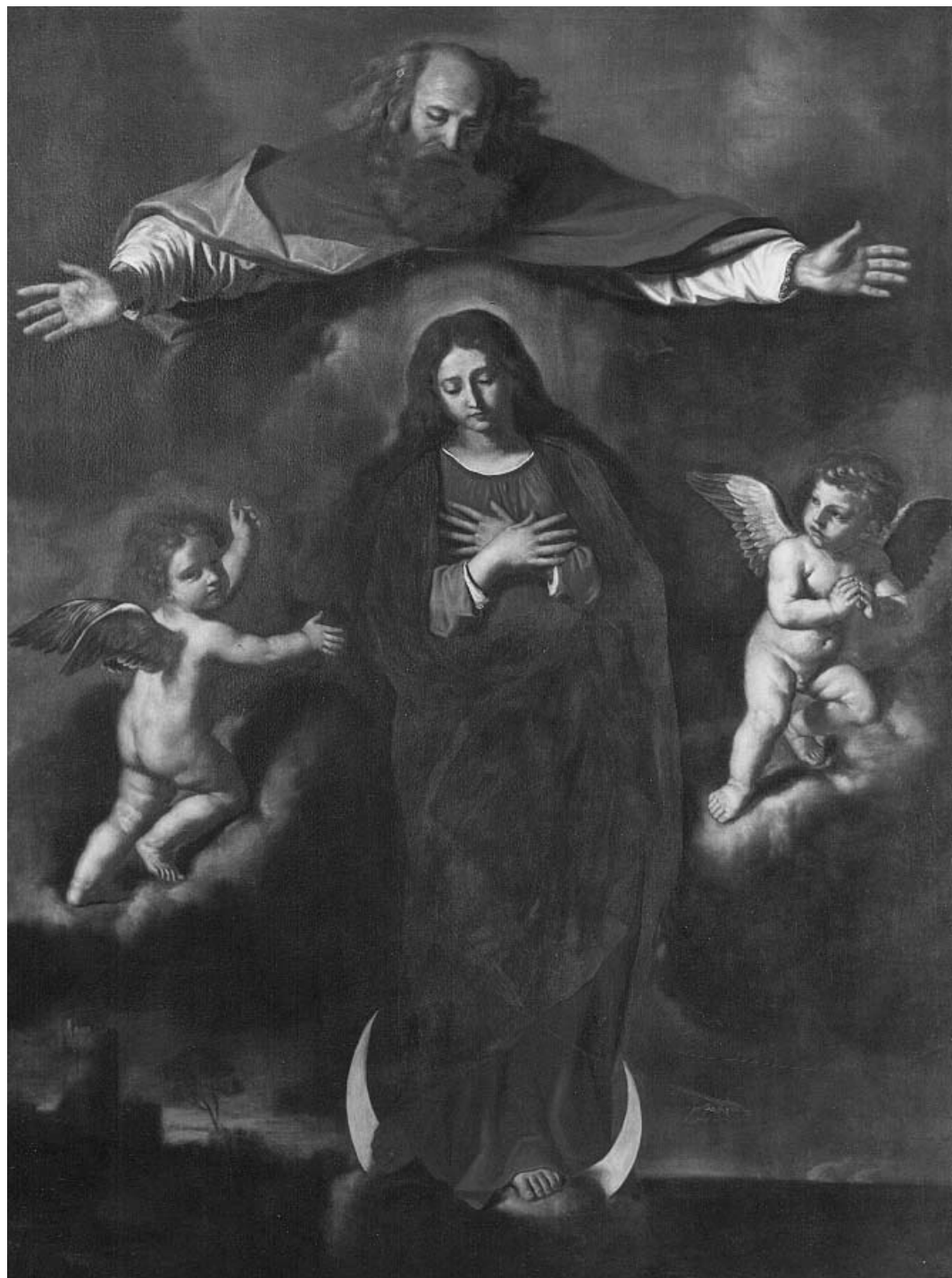
Fig. 1. - Guercino, bottega di, Immacolata Concezione, Pradello di Villimpenta, San Bartolomeo.