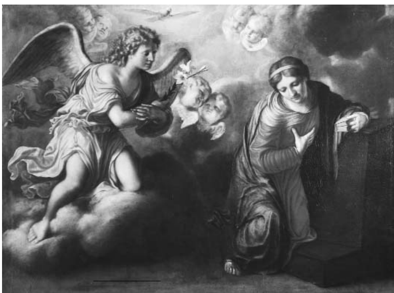
Fig. 6. - Marcantonio Donzelli, Annunciazione , Museo Diocesano.