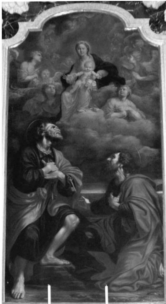
Fig. 4. - Marcantonio Donzelli, Madonna col Bambino e i santi Pietro e Paolo , Mantova, Cattedrale.