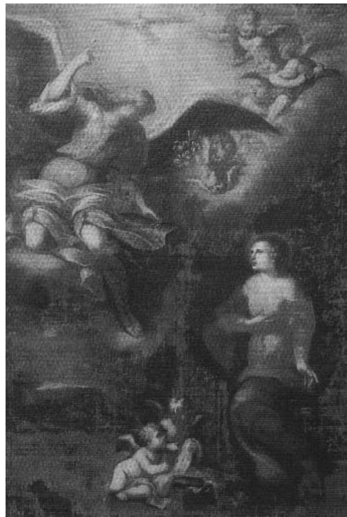
Fig. 5. - Marcantonio Donzelli, Annunciazione , Mantova, Museo Diocesano.