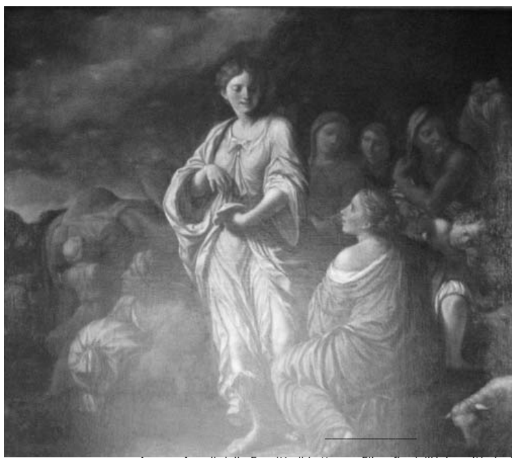
Fig. 9. - Marcantonio Donzelli, Rachele nasconde gli idoli di Labano, Mantova, Sant'Apollonia.