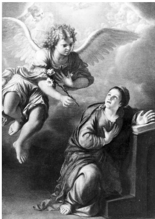
Fig. 8. - Marcantonio Donzelli, Annunciazione, Volta Mantovana, San Pietro.