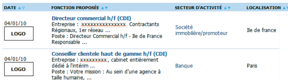
Figure 1 : Exemple de résultat d'une recherche effectuée sur le job board étudié

Afin d'éliminer les variations du rendement liées aux caractéristiques intrinsèques du job board utilisé (audience, type de visiteurs, moteur de recherche, etc.), nous nous concentrerons sur l'étude d'un seul job board de la base de données spécialisé dans les emplois cadres. Deux raisons principales motivent ce choix : l'importance du volume d'offres d'emploi postées sur ce site, et la présence d'un champ segmentant les offres selon la fonction recherchée (cf. section 2). Fig. 1 présente un extrait d'affichage d'offres d'emploi suite à une requête 4 effectuée sur le site en question.