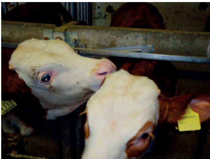
Figura 5. – Succhiamento verso il vitello attiguo subito dopo aver completato la poppata.