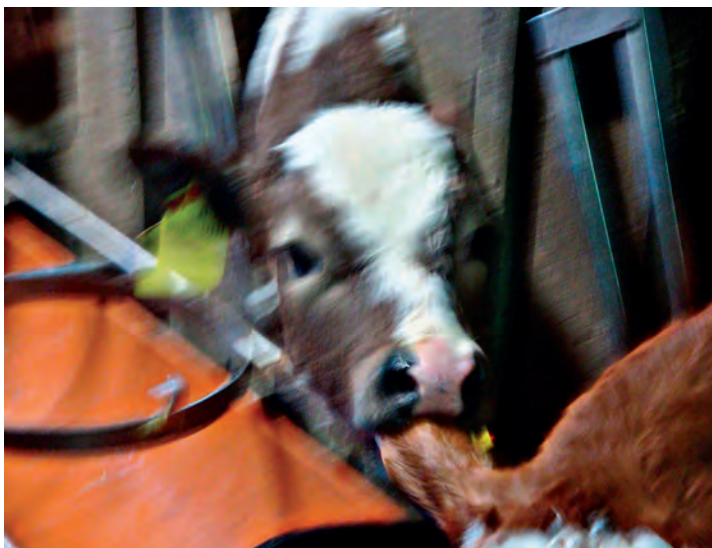
Figura 6. – Altro esempio di succhiamento verso il vitello attiguo subito dopo aver completato la poppata.