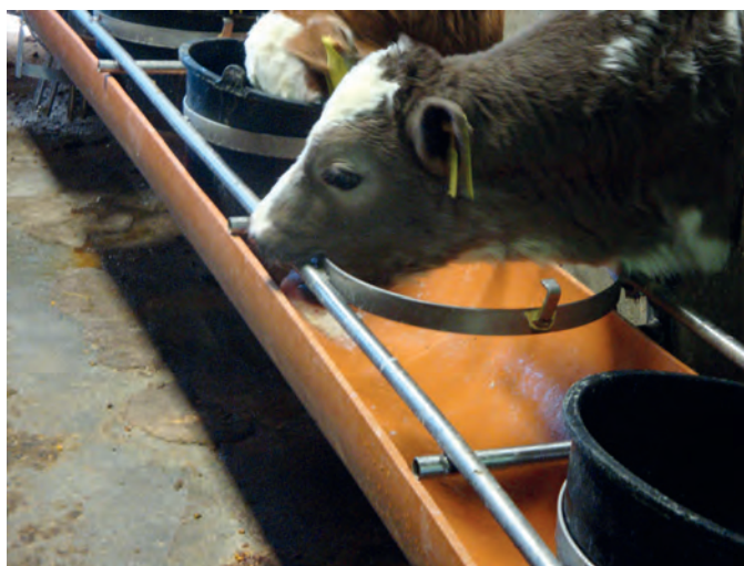
Figura 8. – Stereotipie in vitelli.

L'etica occidentale ha costruito il suo pensiero sul senso di responsabilità – sul dovere di proteggere e prendersi cura l'un l'altro – ma nella sua storia spesso ha accantonato, per ignoranza o persino per l'assoluta indifferenza riguardo agli effetti delle nostre azioni, ogni imperativo morale nel momento che ha acquisito stili di vita più confortevoli e prosperi 15 (Fig. 8).