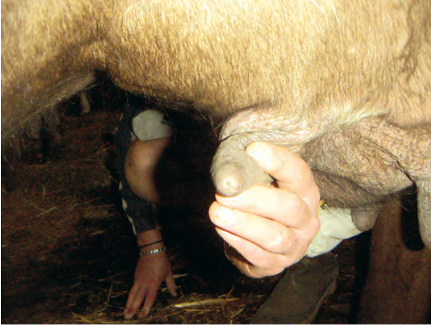
Figura 2. – Dimensioni del foro canicolare del capezzolo in bovina.

L'effetto della suzione del capezzolo da parte del vitello in natura implica uno sforzo considerevole oltre che una giusta postura del corpo, entrambe funzionali al suo sviluppo; infatti il coordinamento e lo sforzo meccanico di pompaggio effettuato dal vitello permettono una giusta e armonica crescita dell'apparato respiratorio che viene stimolato dalla necessità della poppata; inoltre l'estensione del collo in direzione della mammella riduce i rischi della mancata chiusura della doccia esofagea con il pericolo che quantità di latte vadano nel rumine anziché nel suo naturale stomaco, l'abomaso (Fig. 3).