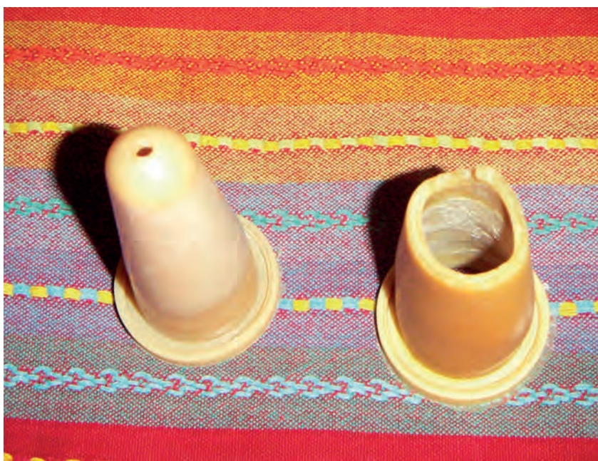
Figura 4. – A sinistra: dimensioni del foro di una tettarella al primo giorno. A destra: dimensioni del foro della stessa tettarella dopo 40 giorni.

Una postura a collo esteso e la lenta suzione favoriscono una corretta chiusura della doccia esofagea permettendo un corretto direzionamento del latte introdotto che by-passa il rumine, entrando direttamente nell'abomaso dove formerà il caglio e riduce i pericoli di indigestione ruminale.