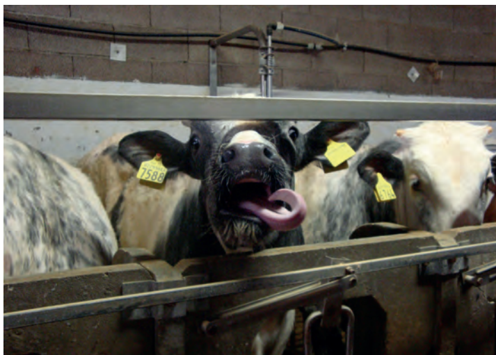
Figura 7. – Battilingua o lingua serpentina.

Un flusso di suzione lento pari al rilascio naturale del latte materno corrisponde all'assunzione massimo di un litro di latte ogni tre minuti e svolge una funzione attiva di stimolazione delle ghiandole salivari e dei muscoli masticatori riducendo i fenomeni di 'succhiamento non naturali' (Figg. 5-6) e altre tecnopatie quali il battilingua o lingua serpentina (Fig. 7).