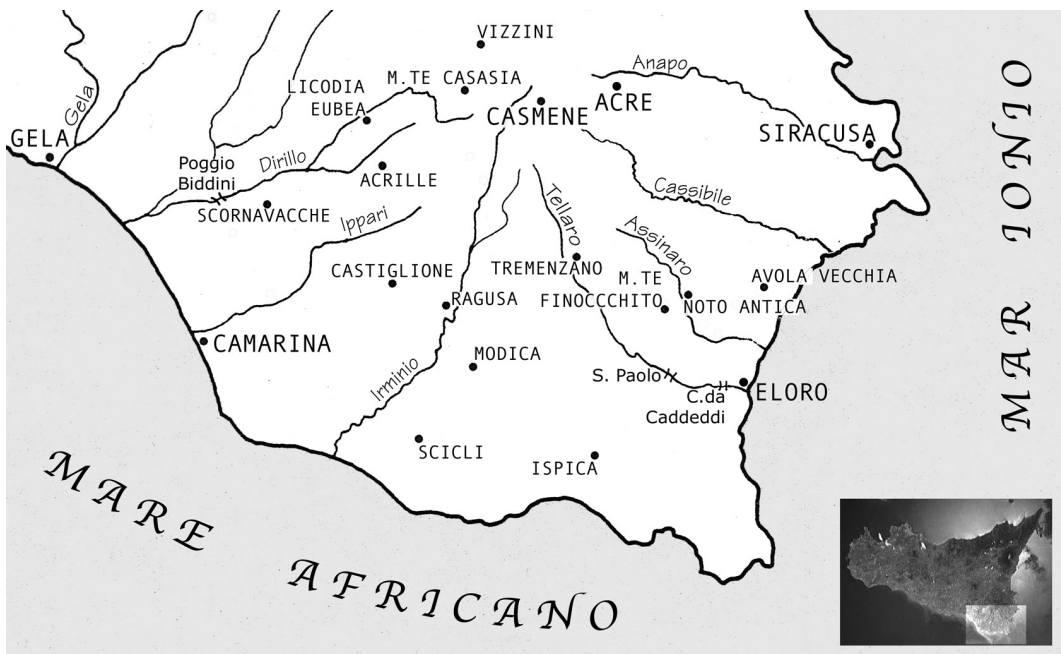
Fig. 1. - Sicilia sud-orientale.