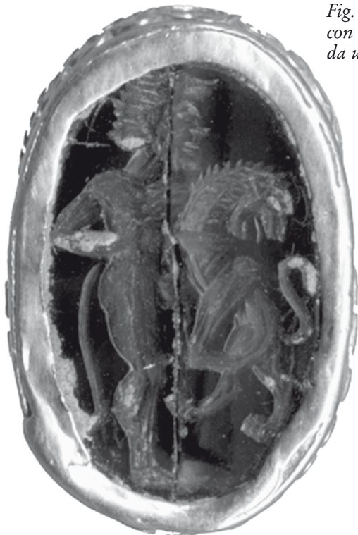
Fig. 3. - Fratte. Corniola con Eracle con il leone nemeo da un pozzo dell'area sacra dell'acropoli.