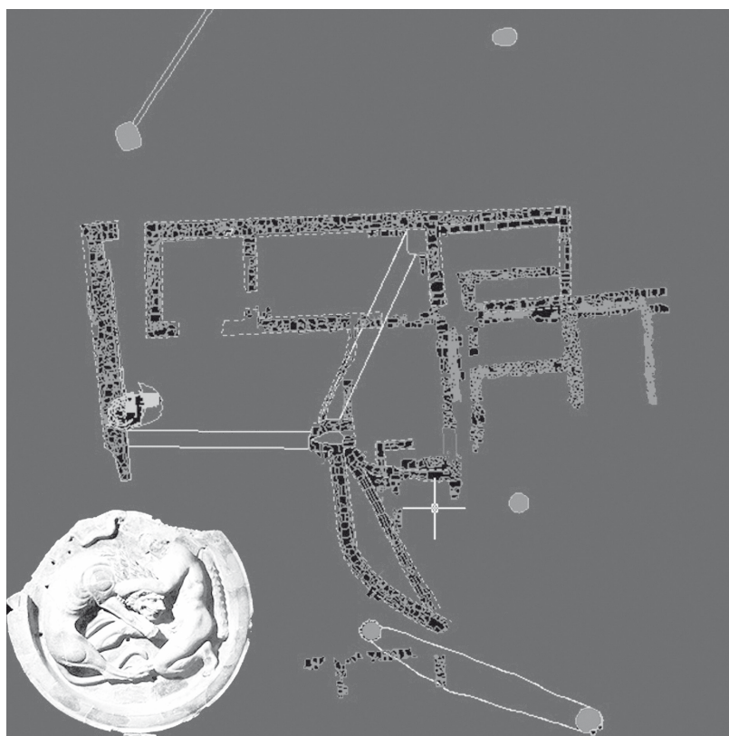
Fig. 4. - Fratte. Pianta dell'edificio sacro di IV sec. a.C., dell'area sacra dell'acropoli e clipeo con Eracle e il leone nemeo.