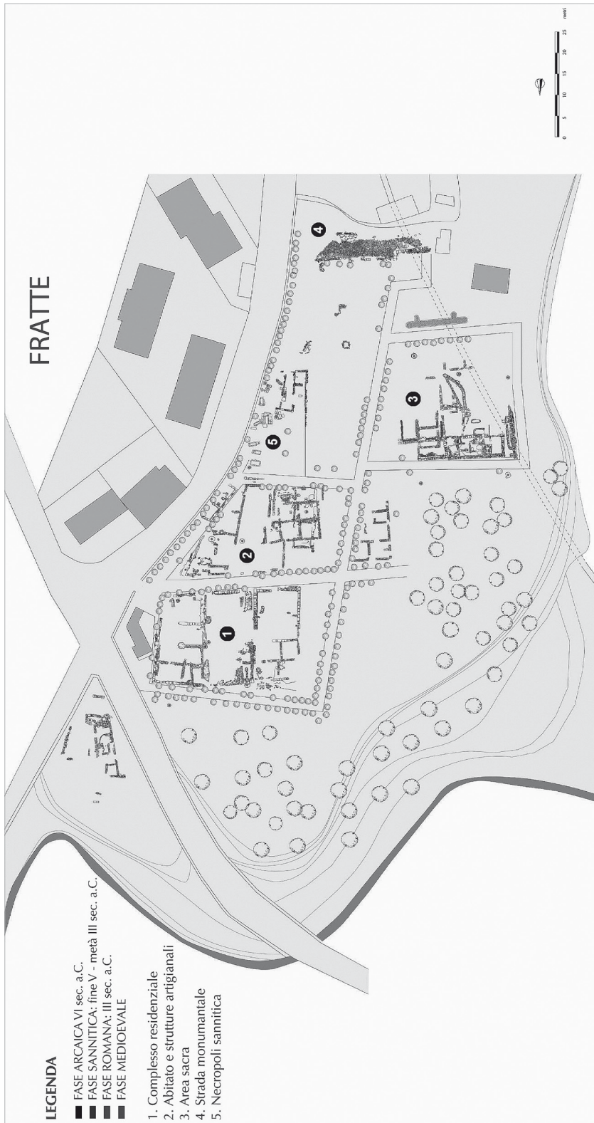
Fig. 2. - Il sito di Fratte per fasi cronologiche.