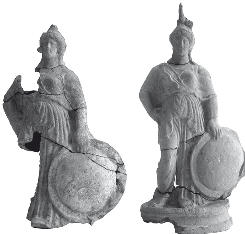
Fig. 6. - Paestum. Terrecotte dal tempio di V sec. a.C. presso Porta Sirena.

ma anche un' applique raffigurante un giovane nudo affiancato da un ariete, che si confronta con un esemplare simile proveniente dall' Athenaion cittadino, e ancora eroti e thymiatheria a forma di "donne fiore".