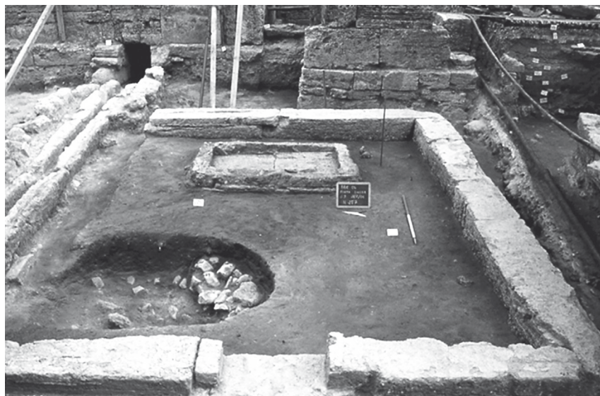
Fig. 5. - Paestum. Tempio di V sec. a.C. presso Porta Sirena.

Per quanto attiene alle trasformazioni politiche e sociali di Poseidonia da città greca a realtà urbana lucana, non ripeterò quanto sostenuto in numerosi lavori fondati su dati ricavati dall'analisi dei contesti funerari e su indagini sistematiche condotte nell'abitato, in particolare con riguardo agli spazi pubblici, e nel territorio 5 . Mi soffermerò su un contesto venuto alla luce di recente con gli scavi effettuati presso Porta Sirena, funzionali agli interventi di restauro del tratto orientale delle mura condotti dalla Soprintendenza Archeologica, cui ha collaborato l'Università di Salerno 6 (Fig. 5).