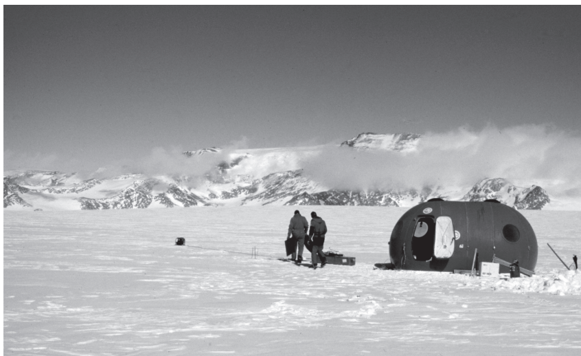
Fig. 5. - L'insediamento effimero nell'interno.