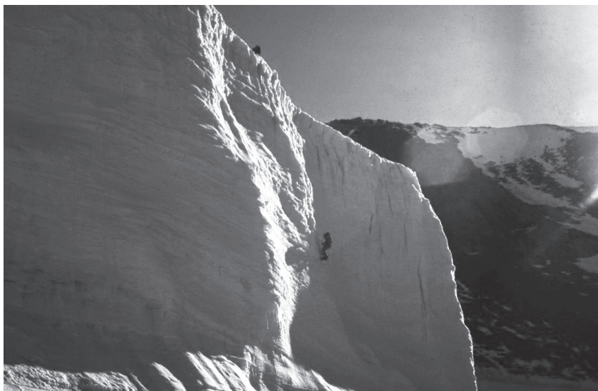
Fig. 10. - La parete di ghiaccio: ricerca e avventura.