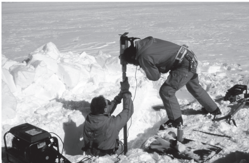
Fig. 9. - Perforazioni antartiche: fra passato e futuro.