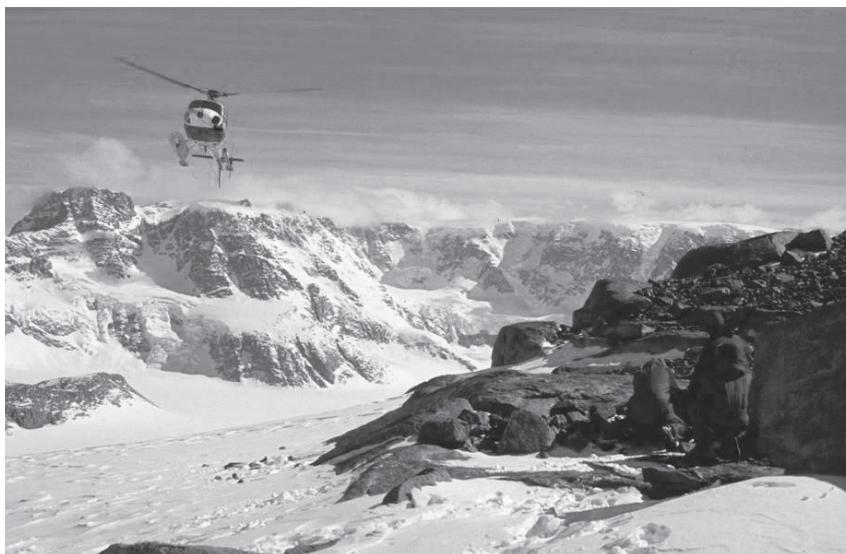
Fig. 8. - Ricercatori ed elicottero: le macchine moltiplicano le possibilità.