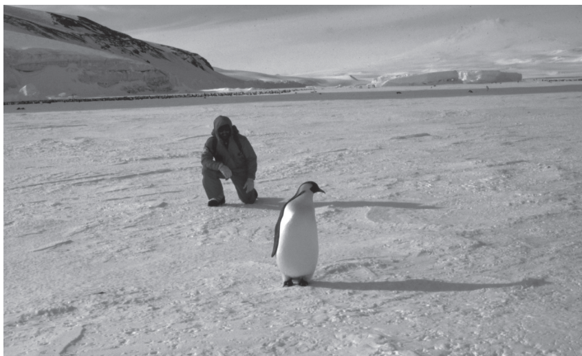
Fig. 3. - Uomo e pinguino: tentativo di colloquio.