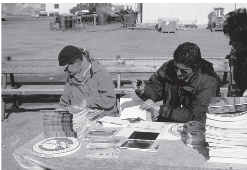
Fig. 6. - Turismo antartico: depliant e timbro sul passaporto.