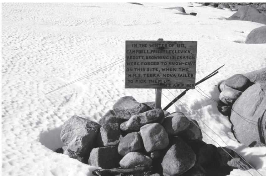
Fig. 2. - Tracce dell'eroismo dei pionieri.