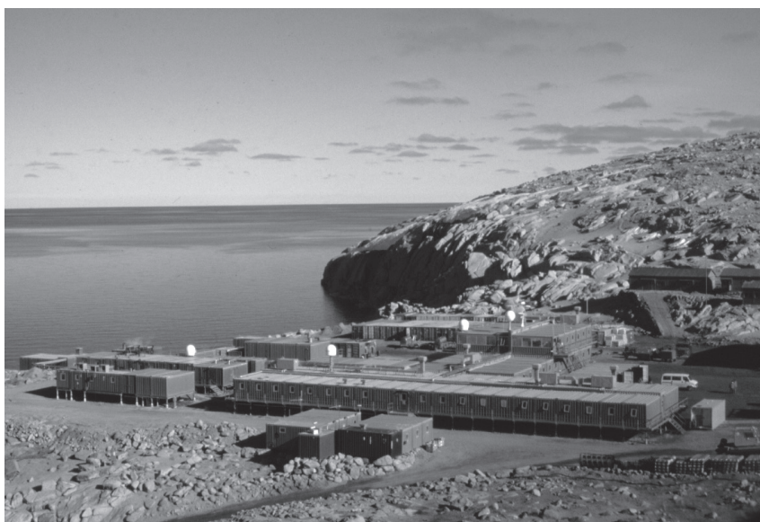
Fig. 4. - L'insediamento costiero: la Base italiana «Mario Zucchelli» sul Mare di Ross.