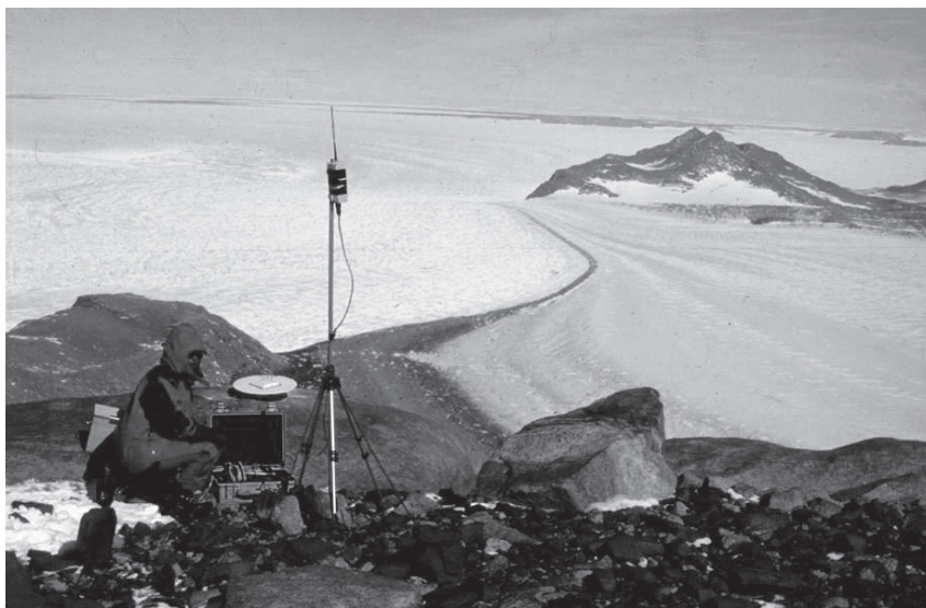
Fig. 7. - Per conoscere meglio anche noi stessi: la scienza antartica.