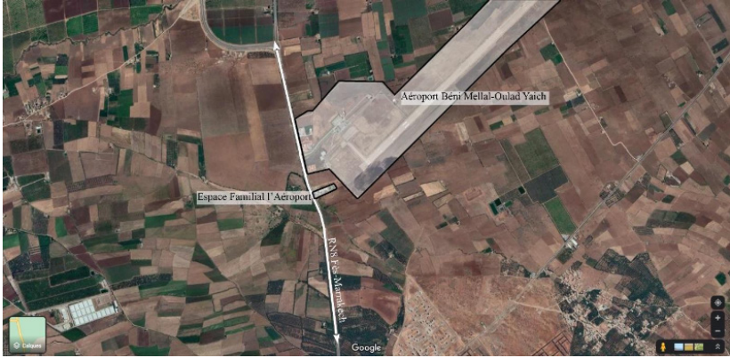
Figure 4. – Situation de l'Espace Familial l'Aéroport.