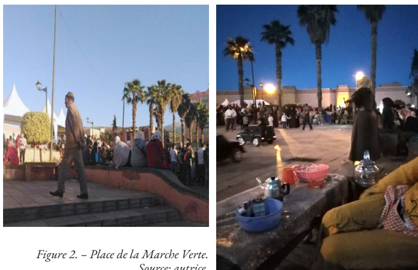
Figure 2. – Place de la Marche Verte.

Ce décalage entre usage prévu et pratique réelle replace la production des espaces publics au centre des dynamiques des usagers, qui lui accordent, à travers leurs pratiques quotidiennes, de nouveaux sens (Korosec-Serfaty 1988) ( Fig. 2 ).