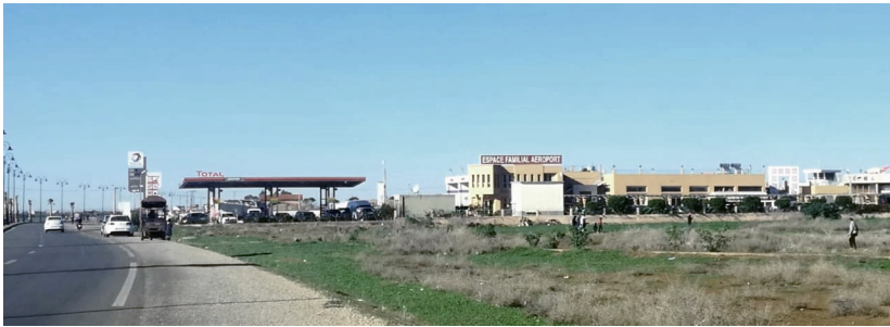
Figure 5. – Situation de l'Espace Familial l'Aéroport.

L'Espace Familial l'Aéroport se présente comme un espace rectiligne, traversé de bout en bout. Comportant une partie couverte (un café-restaurant) et une partie en plein-air (un café-air de jeux pour enfants), l'accès à l'espace d'assise se fait uniquement à partir de l'espace de consommation (la partie couverte), de forme rectangulaire dégagé de poteaux ou tout ce qui peut constituer un camouflage ou un abri visuel. L'espace de consommation se prolonge à l'extérieur, dans le jardin, aussi ouvert et dégagé visuellement.