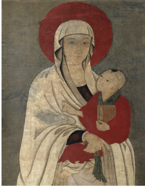
Figura 2. – “Chinese Madonna scroll”, Museo Field di Chicago.

Un'altra intersezione culturale in cui Ricci ha svolto un ruolo importante è il caso di Cheng shi mo yuan 程氏墨苑 (‘Il giardino dell’inchiostro della famiglia Cheng’), una raccolta pubblicata nel 1605 di Chen Dayue 程大约 che catalogava disegni ornamentali per incensieri e tavolette di inchiostro. Questa opera acquisì significato poiché fu la prima del suo genere in Cina, mostrando lo stile di incisione in rame occidentale, caratterizzato dalla profondità di luci e ombre e da rappresentazioni realistiche. Ricci possedeva una collezione di stampe che esponeva, condivideva o anche regalava ai suoi pari cinesi. Alcune di queste stampe, probabilmente senza che Ricci ne fosse consapevole, finirono nelle mani di Cheng Dayue, un artigiano specializzato nella produzione di tavolette di inchiostro (Menegon, 2009).