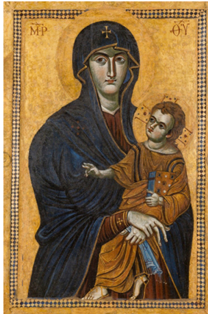
Figura 1. – “ Salus Populi Romani ”, Basilica di Santa Maria Maggiore, Roma.

Sia yin yang 阴阳 sia aotu 凹凸 sono reinterpretazioni localizzate che tentano di integrare la tecnica artistica introdotta dall’Occidente con le tradizioni cinesi. Questo è un tratto tipico della politica di localizzazione messa in pratica, sia sul piano culturale sia sul piano religioso, dai gesuiti in quel periodo. Questo fenomeno di interiorizzazione linguistica supporta anche l’osservazione di Sullivan (1989: 2-3) secondo cui la Cina ha un profondo fondamento culturale tradizionale. Gli artisti cinesi si sono dimostrati nei secoli molto cauti riguardo all’adozione di modelli stranieri, che, prima di essere accettati dal popolo cinese, sono dovuti passare attraverso un processo di trasformazione a contatto con la cultura tradizionale.